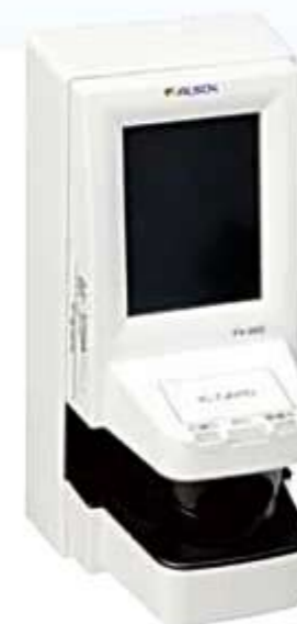
指静脈入退管理システム

オフィスビルや一般家庭などの契約先に侵入警戒用のセンサーや非常通報装置などの機器類を設置。万一、盗難・火災などの異常が発生した場合、瞬時にコントロールセンタに通報され、専門の指令員の指示により警備員が現場に急行し、被害を最小限に食い止めます。