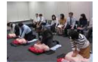
救命講習・応急救護実技訓練